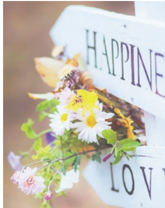
アウトドアウェディング