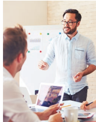
宣伝会議開催講座