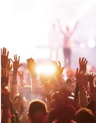
日本最大級の音楽フェス